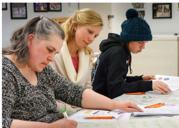
En av tre träffar där vi diskuterade kvinnors behov.

Sluta säga: "Det går aldrig" Börja säga: det går visst!