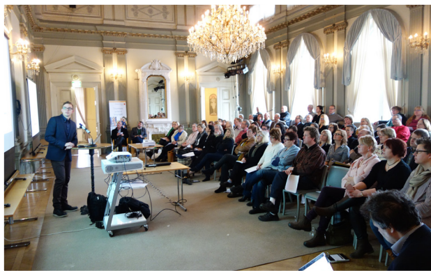
Framtidsdagen om e-handel på Nora Stadshotell